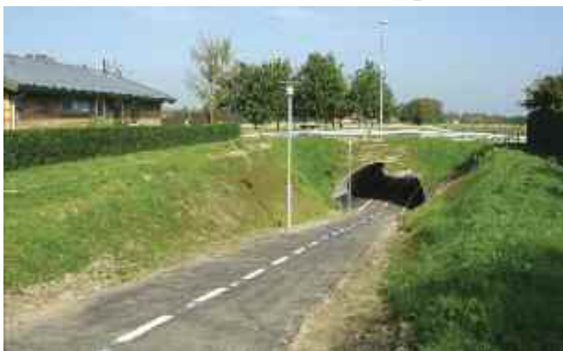
Stitunnel næsten færdig - oktober 2011