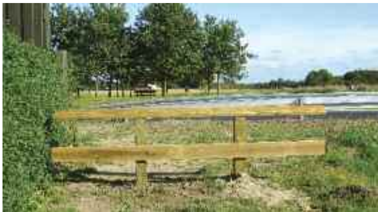
Fodhegn mod Hundievej

Alt i alt synes vi, at det skal fremhæves som positivt ved tunnelen, at det for områdets mange børn nu er blevet mere sikkert at ‘krydse’ Hundievej og komme til SFO/klubben samt privatskolerne. Kommunen har efter behørig nabohegning opstillet fodhegn på begge sider af tunnelen på grundejerforeningssiden. Den sikre passage medfører dog indtil videre, at f.eks. motionister og an-