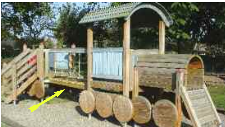
Køreklart igen efter reparation