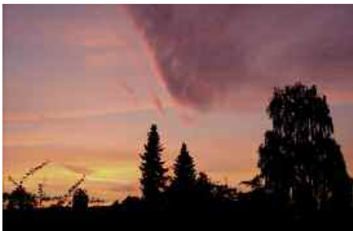
Oktobers Himmel over Hundiegård