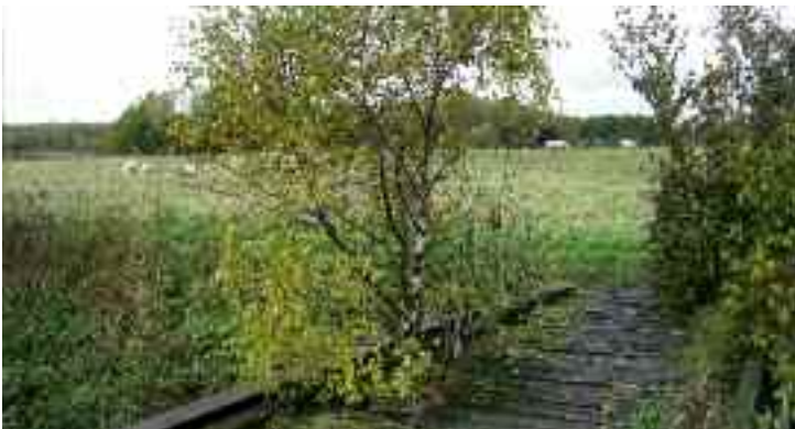
Bro over "grænsefloden" til Ishøj Kommune